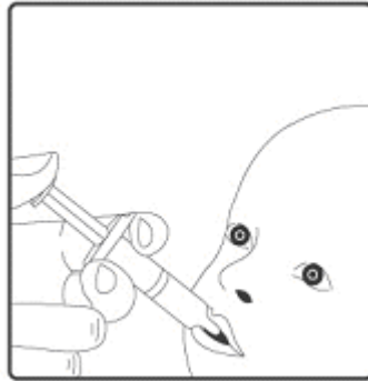
2. Bu aşı sadece oral uygulama içindir. Çocuk yaslanma pozisyonunda oturtulmalı ve oral aplikatörün tüm içeriği yanağın iç tarafına oral yolla uygulanmalıdır.